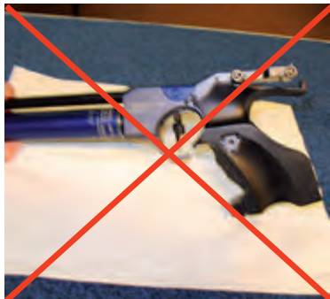
Ausfräsung am Griffboden