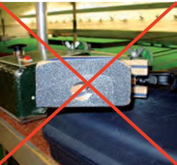
Griffboden mit Schleifpapier

Verwendet werden dabei handelsübliche Luftpistolen. Es gilt die SpO Teil 2 (Pistole) bezüglich aller Abmessungen und Beschreibungen sowie Visiere. Zu beachten ist hierbei auch die Pistolentabelle der Sportordnung. Spezielle Ausfräsungen (z. B. für die unterhalb des Pistolengriffes angebrachte Auflageplatte usw.) am Griff sind nicht gestattet. Ebenso ist es nicht gestattet, Pistolengriffe auf der Unterseite mit rauhem Material (z. B. Schleifpapier) zu versehen.